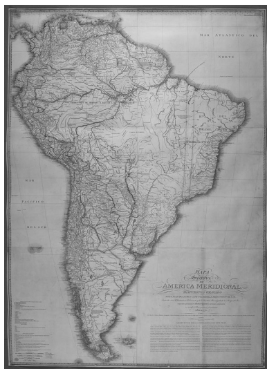
Imagen 3. América meridional.

Fuente: J. de la Cruz Cano y Olmedilla, “Mapa Geográfico de América Meridional”, Londres, Guillermo Faden, 1775.