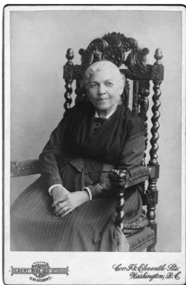
"Harriet Jacobs en 1894. Único retrato formal conocido, Gilbert Studios, Washington D. C."