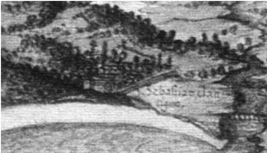
Pedro Teixeira, Cartografía de San Sebastián , ca. 1622. "San Sebastián s. xviii", Wikipedia , s. d.

Luego de escapar de San Sebastián por el bosque, donde se escondió, como ella dice, en un castañar, Catalina se fue caminando hasta Vitoria, ciudad que está a más de 100 kilómetros desde el puerto. He estado buscando cómo puede ser el bosque a donde huyó. Según una ilustración cartográfica de 1622 (imagen 1), el convento, que se encontraba ubicado a un costado de la antigua parroquia de San Sebastián, tenía detrás pequeñas colinas montañosas. Gracias a la